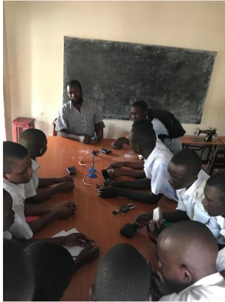
Alumnos durante el taller de fotografía

El colegio también tiene cuartos de baño, una sala de profesores, un despacho para el director, las habitaciones de las internas, algunas salitas pequeñas que hacen las veces de almacenes y por último una pequeña cocina donde los alumnos se preparan diariamente la comida: judías con posho.