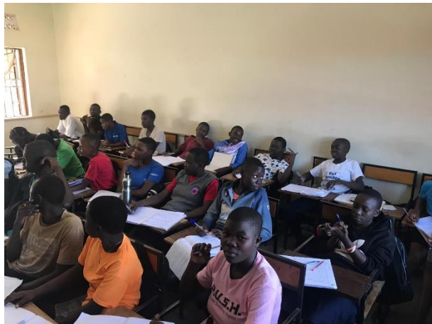
Senior 3 durante el cambio de clase