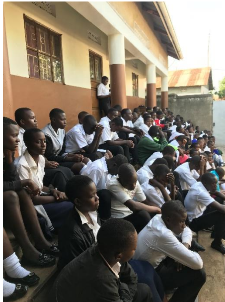
Alumnos rezando durante la asamblea general

El colegio también acoge a varias chicas internas, que además de estudiar en el colegio, duermen en él, incluidos fines de semana. De las internas se ocupa una voluntaria local, que duerme con las chicas y se ocupa de su manutención.