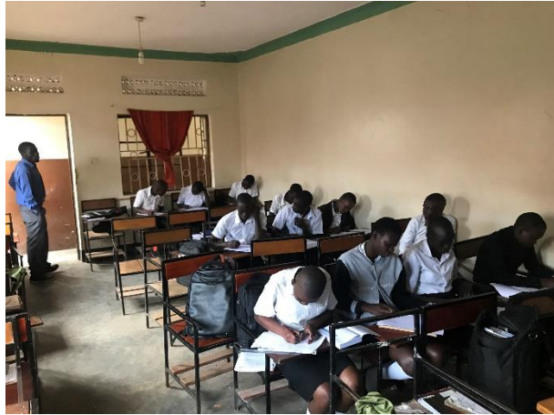
Senior 4 durante un examen de química

Aparte de las clases, los alumnos pueden realizar la parte práctica de las asignaturas de ciencia en un laboratorio bien equipado: