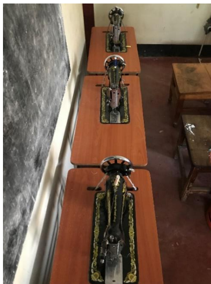
Máquinas de coser para el taller de costura.

Además, es el aula de apoyo, donde se realizan clases extraordinarias de fotografía y costura: