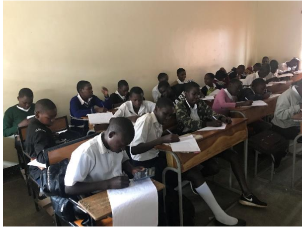
Senior 1 en clase de matemáticas