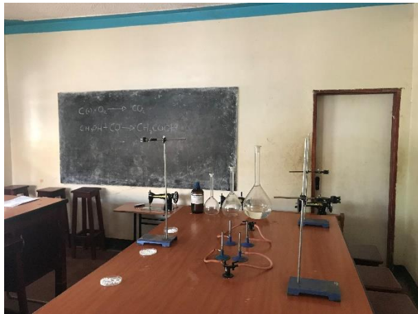
Laboratorio de física, química y biología

Aparte de las clases, los alumnos pueden realizar la parte práctica de las asignaturas de ciencia en un laboratorio bien equipado: