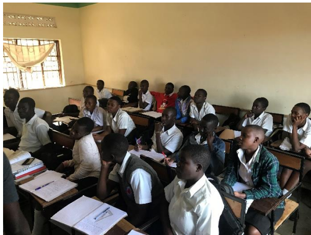
Senior 2 en clase de física