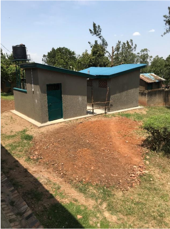
Fotos 3. Vista exterior e interior del nuevo bloque de baños