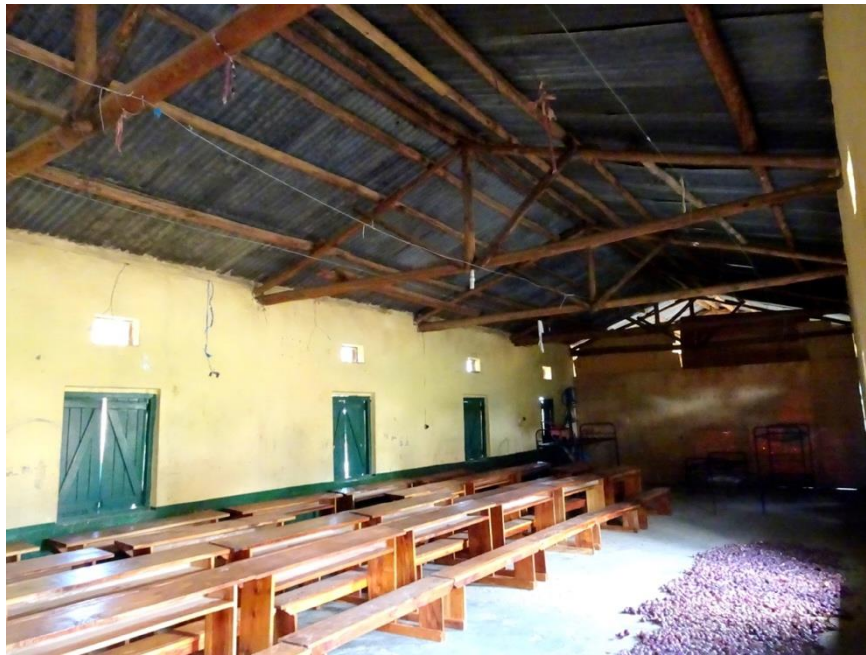
Fotos 5. Estado del tejado interior