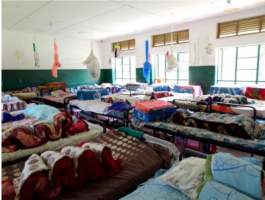
Fotos 5. Vista interior de las aulas habilitadas como dormitorios