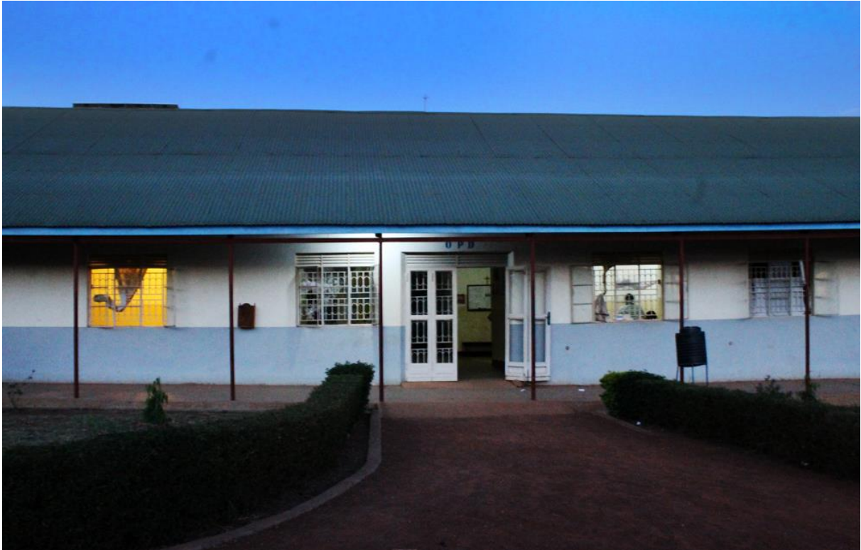
8 Detalle de luces exteriores en la sala de consultas