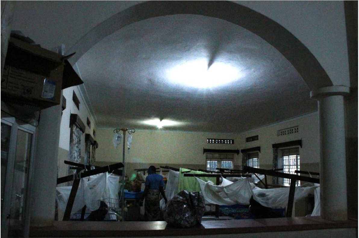
4 Luces en la sala de ingresos