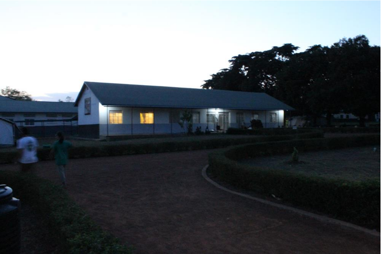
10 Detalle de luces interiores en la maternidad

EL 100% DE LO RECAUDADO SE DESTINA A LOS PROYECTOS