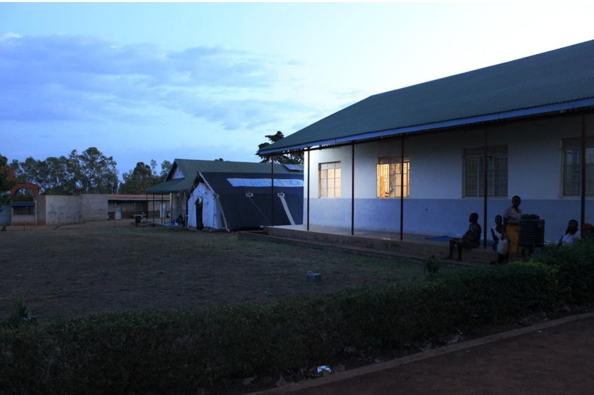
5 Detalle de luces en la maternidad

EL 100% DE LO RECAUDADO SE DESTINA A LOS PROYECTOS