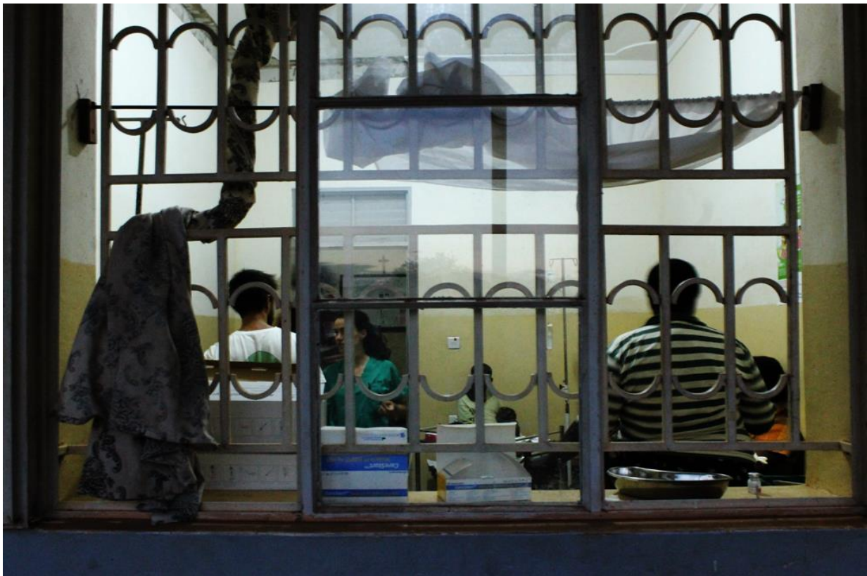
9 Detalle de luces interiores en la sala de consultas

EL 100% DE LO RECAUDADO SE DESTINA A LOS PROYECTOS