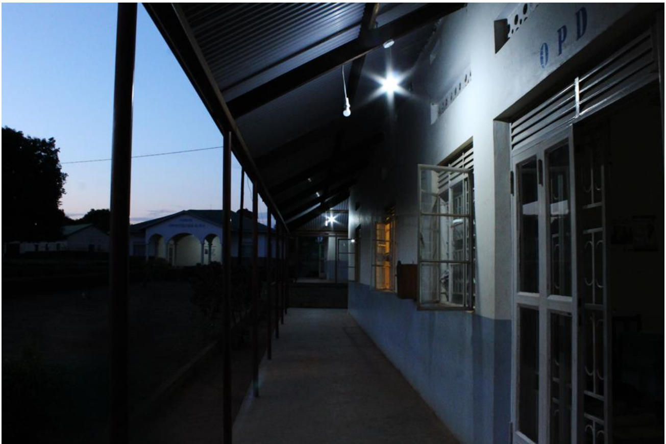
3 Detalle luces de seguridad del bloque de consultas y farmacia

EL 100% DE LO RECAUDADO SE DESTINA A LOS PROYECTOS