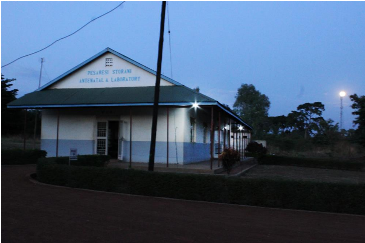
6 Detalle de luces exteriores en el laboratorio