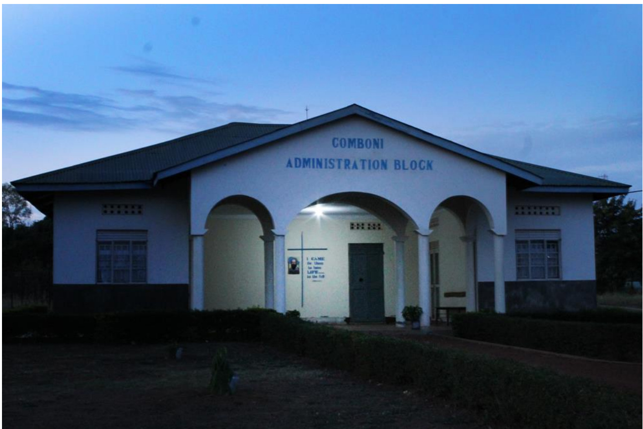
1 Bloque De administración con el nuevo sistema de luz solar instalado.

El objetivo principal de este proyecto es electrificar y ofrecer luz al laboratorio del centro de salud, bloque de administración, OPD y salas de ingresos de mujeres, hombres y niños del Lodonga Health Center.