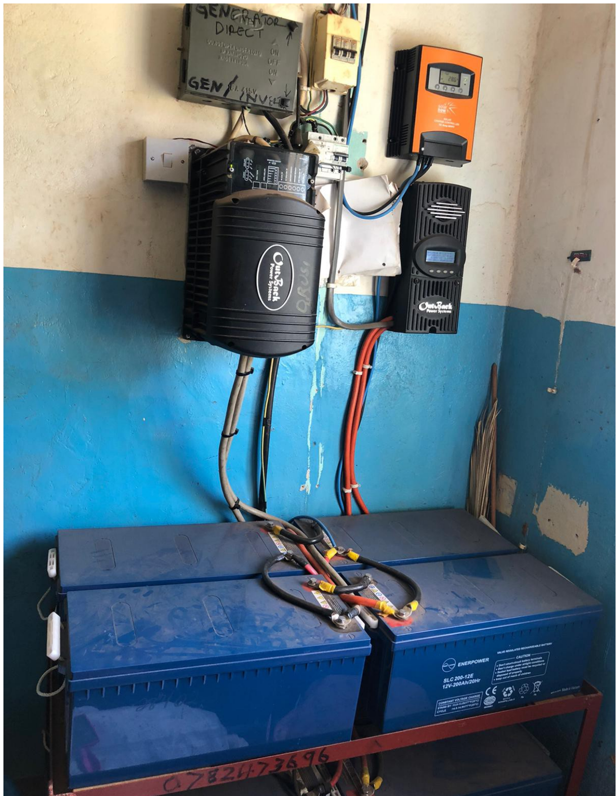
Imagen 8. Foto tomada del convertor y de las baterías instaladas