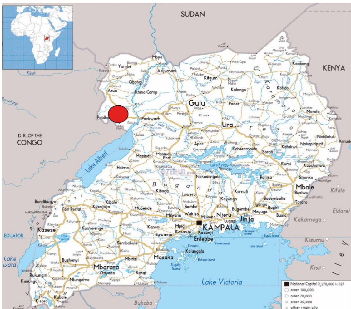
Imagen 1. Situación de Nebbi respecto al mapa de Uganda.

Orussi se encuentra en una zona montañosa en la región de Northern Uganda, subregión de West Nile , distrito de Nebbi. La capital del distrito también se llama Nebbi y está a 22 kilómetros de Orussi y a 77 kilómetros al sur de Arua, la ciudad más grande de la subregión. Además, el distrito de Nebbi limita con el distrito de Pakwach al este, la República Democrática del Congo (RDC) al sur y el distrito de Zombo al oeste. Con una población de 282,600 (hombres: 49% y mujeres: 51%) 1 , más del 91,9% de la población del distrito se dedica a la agricultura de subsistencia y gran parte de lo que se produce se consume a nivel doméstico y menos del 40% se comercializa. Los principales cultivos que se cultivan son algodón, café, simsim, sorgo, mijo, batatas, frijoles, mandioca, maíz y hortalizas.