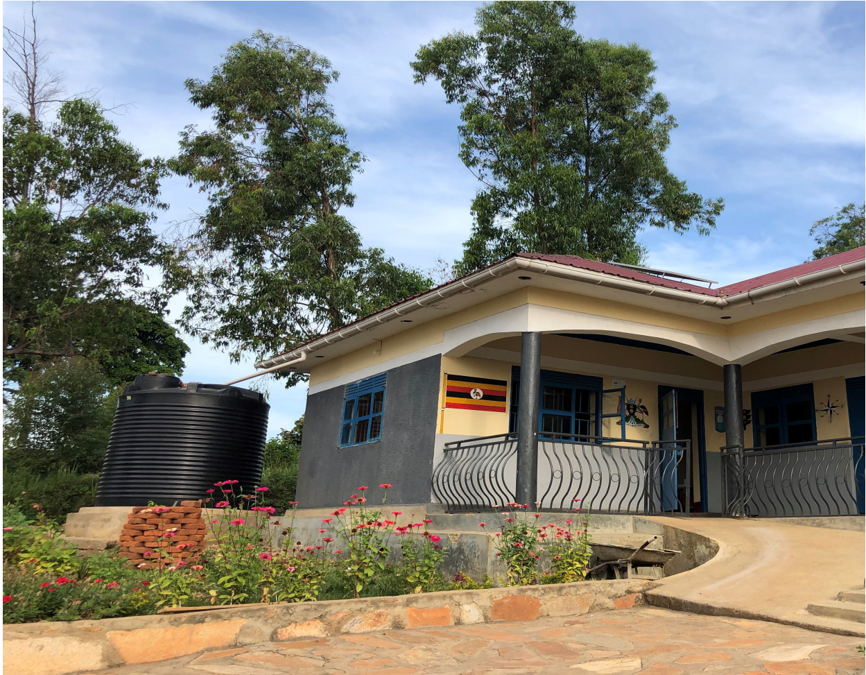
Imagen 5. Foto tomada del segundo tanque de agua en una de las entradas al colegio.

Por un lado, en el Colegio de Primaria se instalaron tres tanques de agua, uno en la entrada del colegio y otros dos en la parte posterior de las aulas. Estos tanques almacenan el agua que proviene de los tejados durante las dos temporadas de lluvia, permitiendo así su uso durante todo el año, especialmente en las dos temporadas secas. Este proceso se realiza gracias a una canalización del agua hacia los depósitos mediante tuberías. En concreto, se instalaron dos tanques de agua preparados para almacenar 10 metros cúbicos (10.000 litros) y otro tanque listo para recoger 5 metros cúbicos de agua (5.000 litros).