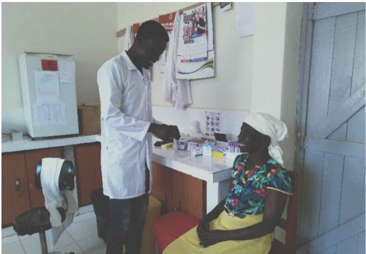
Imagen 3. Foto de uno de los médicos pasando consulta.