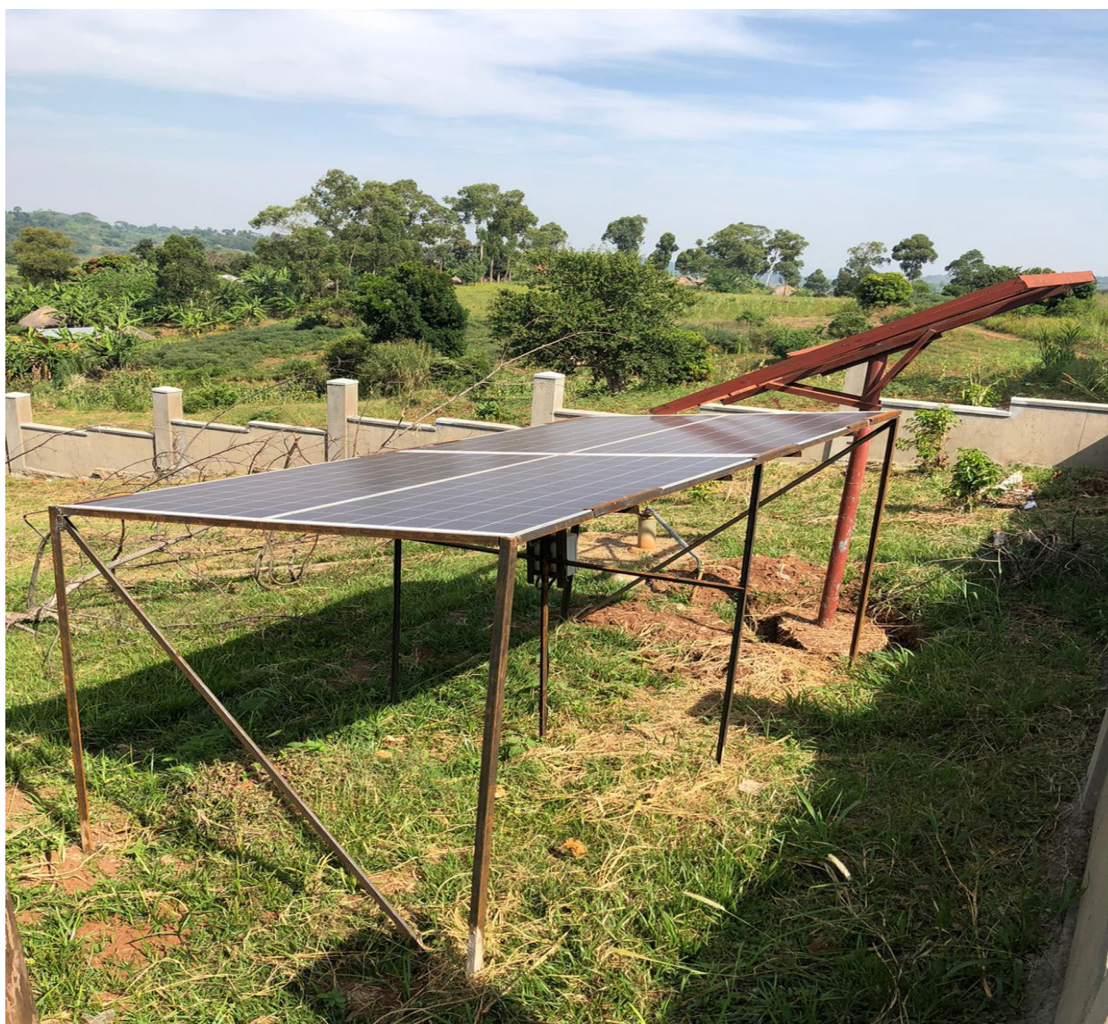
Imagen 7. Foto tomada de los paneles dentro del hospital.

Por otro lado, la instalación de 8 placas solares en el Health Center III de Orussi, también dirigido por la Congregación Sacred Heart Sisters, permite abastecer de luz suficiente las 24 horas al día. De esta manera, se cubren todos los servicios básicos que demanda el correcto funcionamiento del centro.