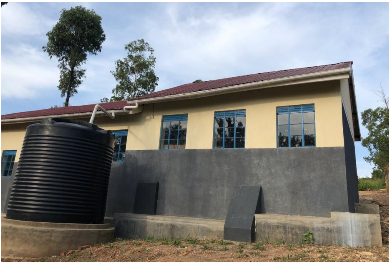
Imagen 4. Foto tomado desde la parte posterior de uno de los edificios principales.

Este año 2020 debido al Covid y las restricciones internacionales, desafortunadamente los voluntarios en el terreno volvieron a sus países al inicio de la pandemia. Durante las semanas posteriores de la instalación de los tanques de agua y los paneles solares no hubo personal voluntario en terreno. A pesar de ello, nos mantuvimos en contacto continuo con las hermanas de la Congregación y con la empresa responsable de los proyectos. Una vez abierta la frontera internacional de Uganda a primeros de Octubre, el personal voluntario de África Directo volvió al país y pudo de comprobar de primera mano no sólo el buen resultado de la instalación, si no cómo mejoró el servicio y la calidad para la comunidad.