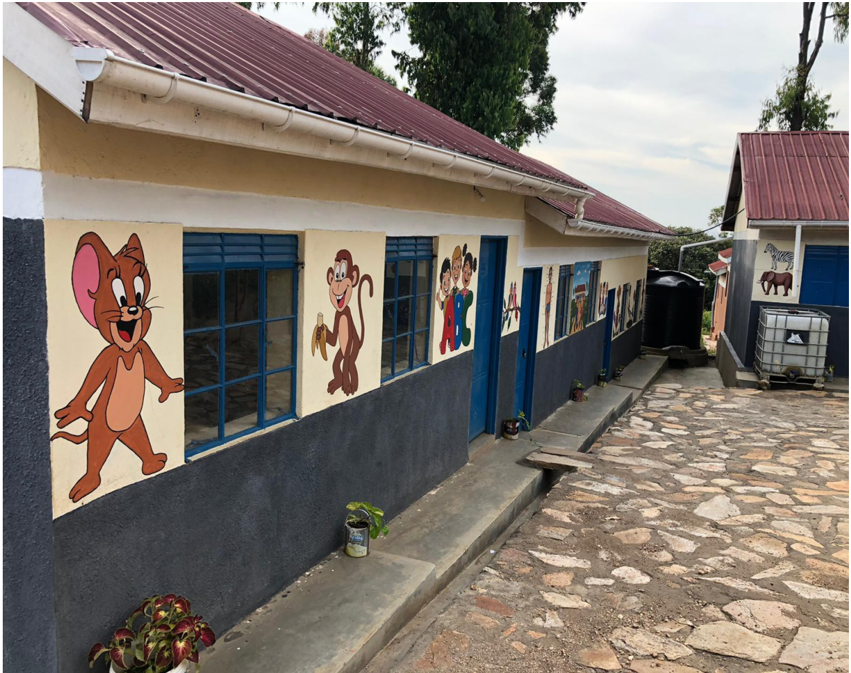
Imagen 6. Foto tomada del tercer tanque de agua que proporciona agua a dos edificios de aulas

Esta canalización del agua de lluvia y la posterior instalación de los tres tanques de agua, ha permitido mejorar la calidad de vida de los estudiantes del centro y de sus docentes, permitiendo el uso de agua limpia durante todo el año. Este proyecto se une al esfuerzo de África Directo por mejorar las instalaciones del Colegio, enlazando durante el mismo periodo con un proyecto de recogida de agua de lluvia en el patio central, caída de agua que incidía directamente en uno de los bloques de clases. Esta reconstrucción del edificio gravemente afectado, la correcta canalización de las aguas del colegio y la instalación de los 3 tanques de agua, pone el broche de oro perfecto en 2020, repercutiendo de manera directa en una mejora de todo el recinto. Desde la comunidad de Orussi y África Directo esperamos con ilusión la vuelta a las aulas tras casi ya un año sin clases debido al Covid y sus restricciones.