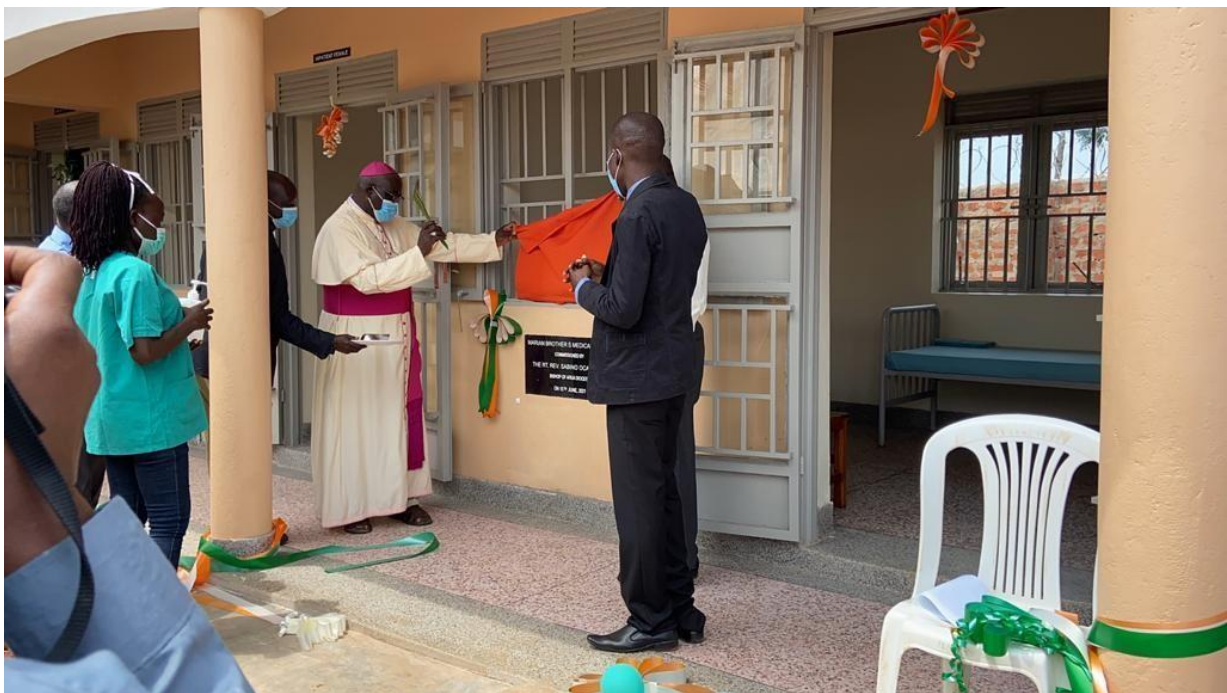
2. Inauguration del Health Center de los Marian Brothers, Junio 2021

Al contar con la experiencia en el sector sanitario gracias al programa de la Clínica Móvil en el campo de refugiados, los Marian Brothers decidieron iniciar la construcción en septiembre de 2020 de un centro de salud en la ciudad de Yumbe, próxima al campo de refugiados de BidiBidi, con el que esperan poder atender a la población local y a los refugiados que no pudieran recibir tratamiento en la ambulancia.