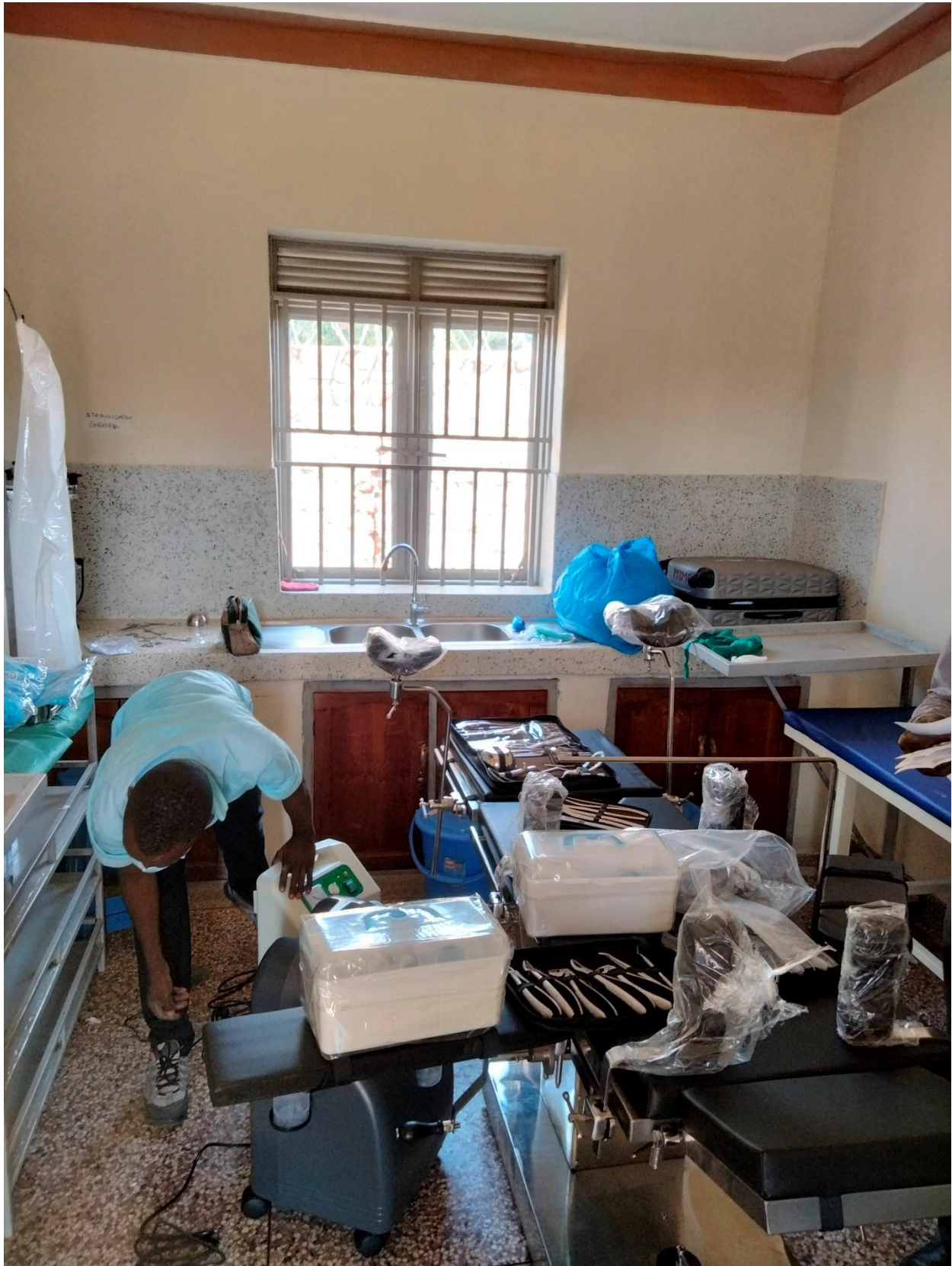
7. Técnico de la empresa instalando el nuevo equipamiento