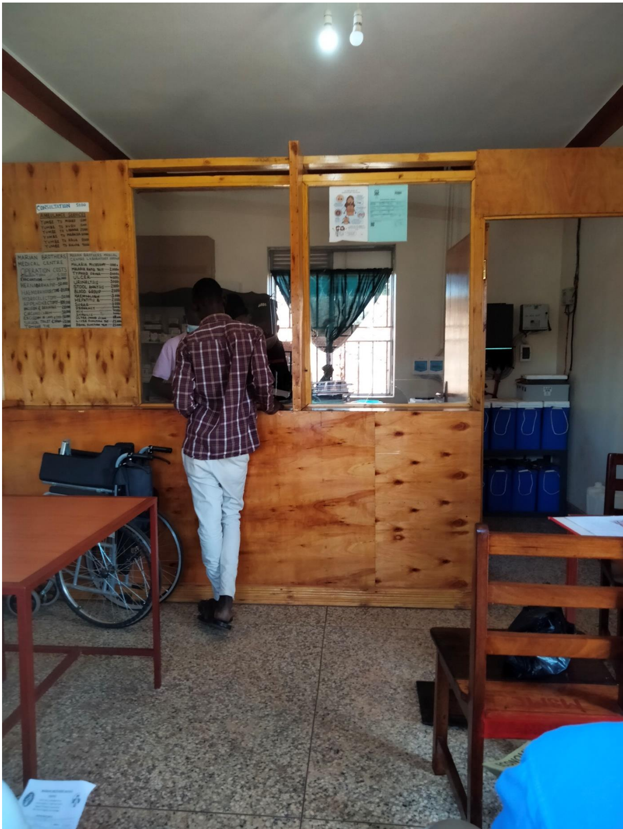
8. Paciente en el mostrador del Health Center

EL 100% DE LO RECAUDADO SE DESTINA A LOS PROYECTOS