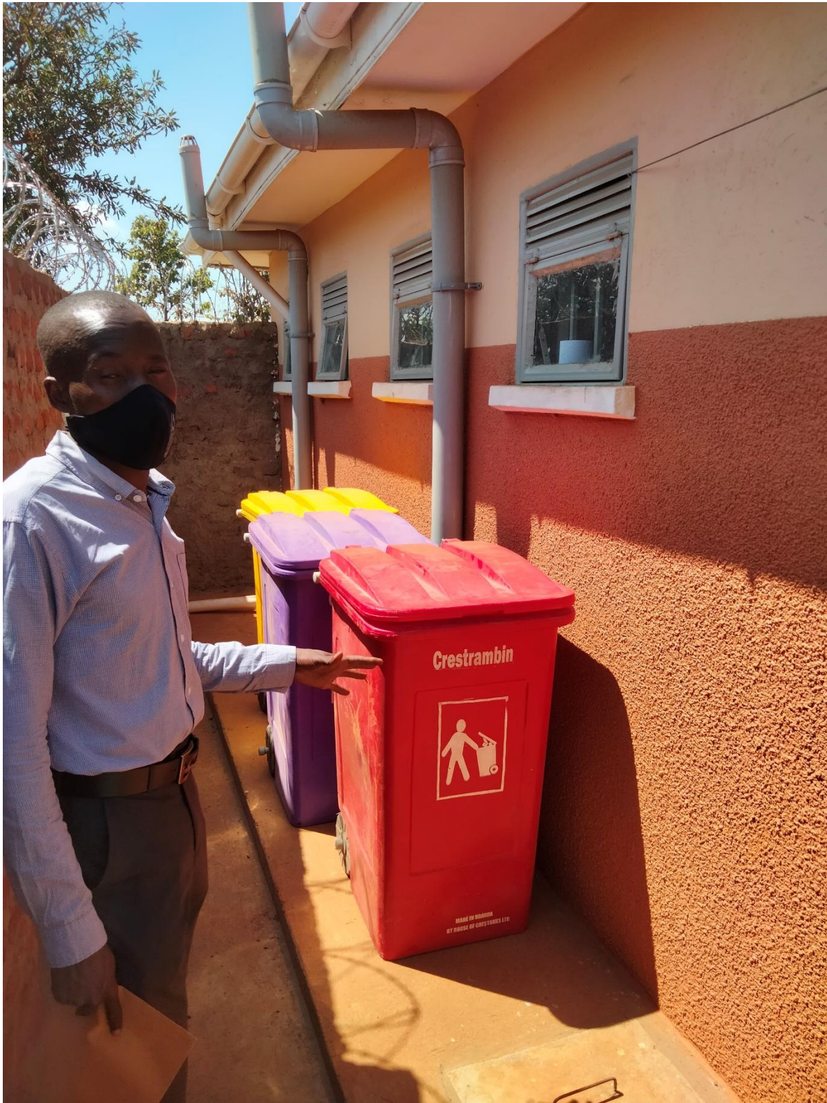
6. Los nuevos cubos de basura para los residuos del HC.

EL 100% DE LO RECAUDADO SE DESTINA A LOS PROYECTOS