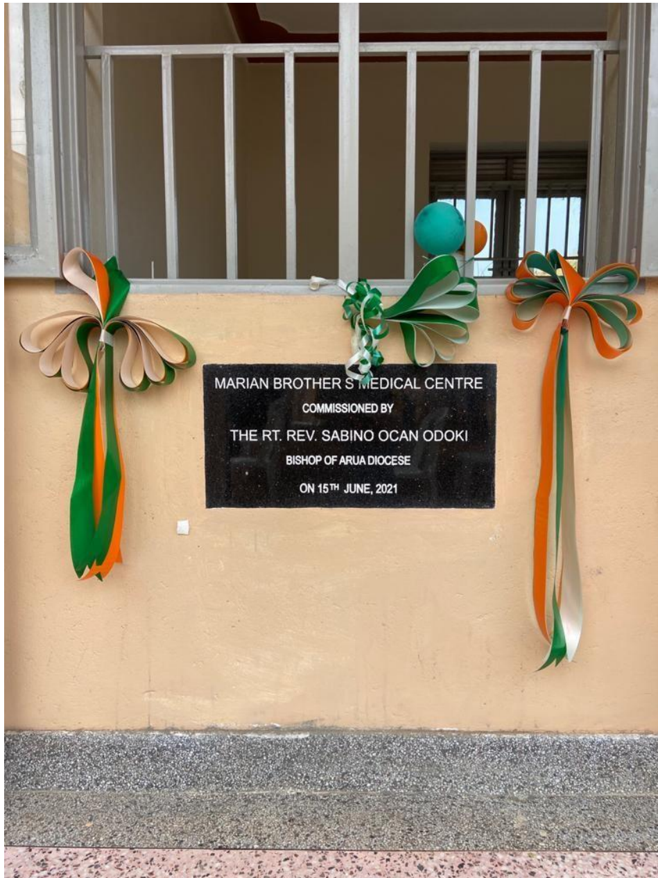
10. Placa Conmemorativa del HC

EL 100% DE LO RECAUDADO SE DESTINA A LOS PROYECTOS