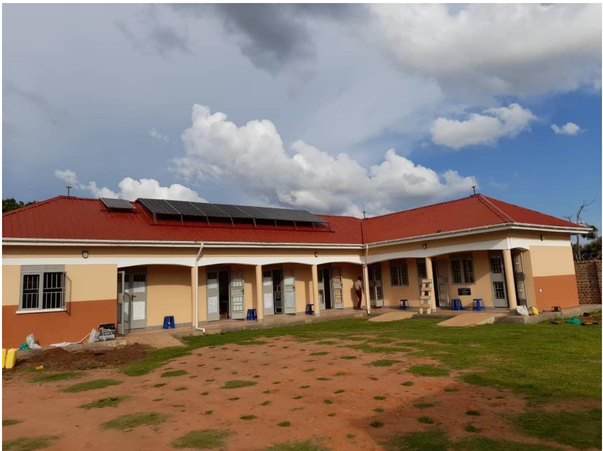
1. Health Center de los Marian Brothers, Yumbe