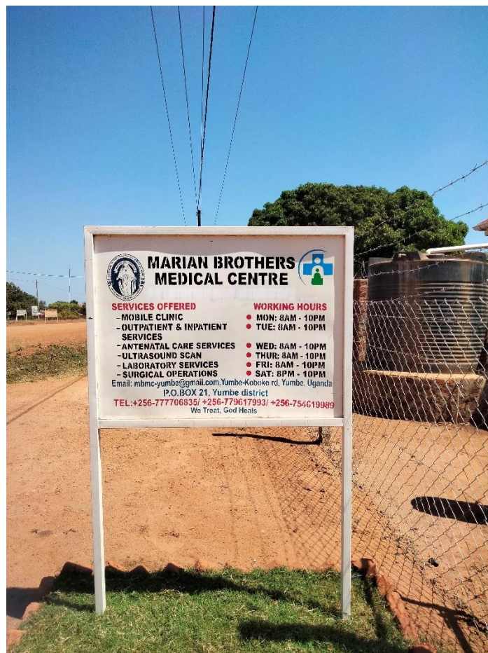
9. Cartel a la entrada del Health Center de los Marian Brothers

Otro paso más hacia el acceso universal a servicios sanitarios. Otro proyecto más que apuesta por la mejora de las necesidades básicas.